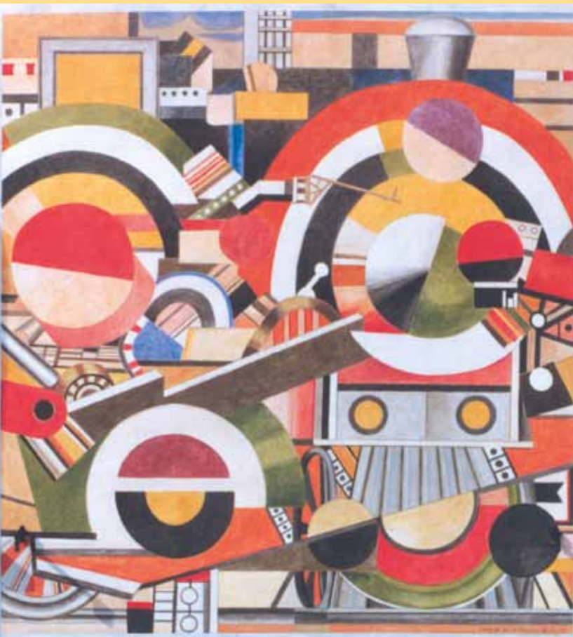
46 - L'arrivo del primo treno